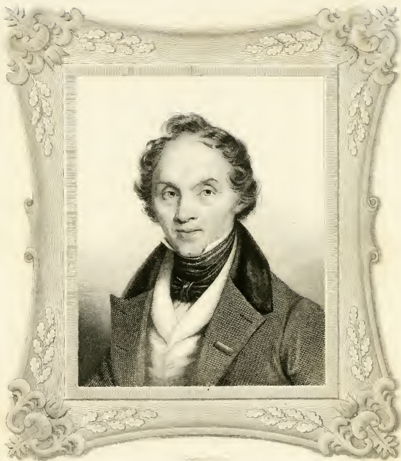
W. H. W. W. W. W.